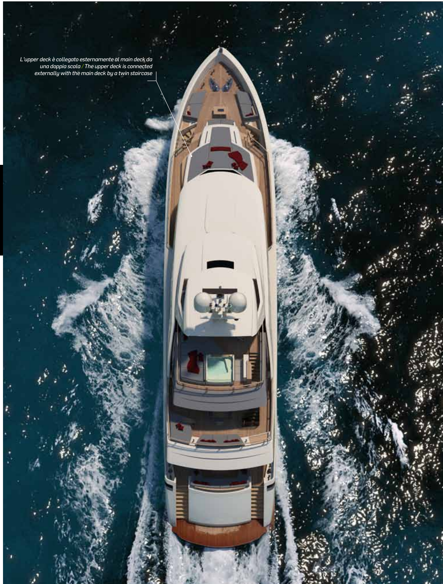
L'upper deck è collegato esternamente al main deck da una doppia scala / The upper deck is connected externally with the main deck by a twin staircase