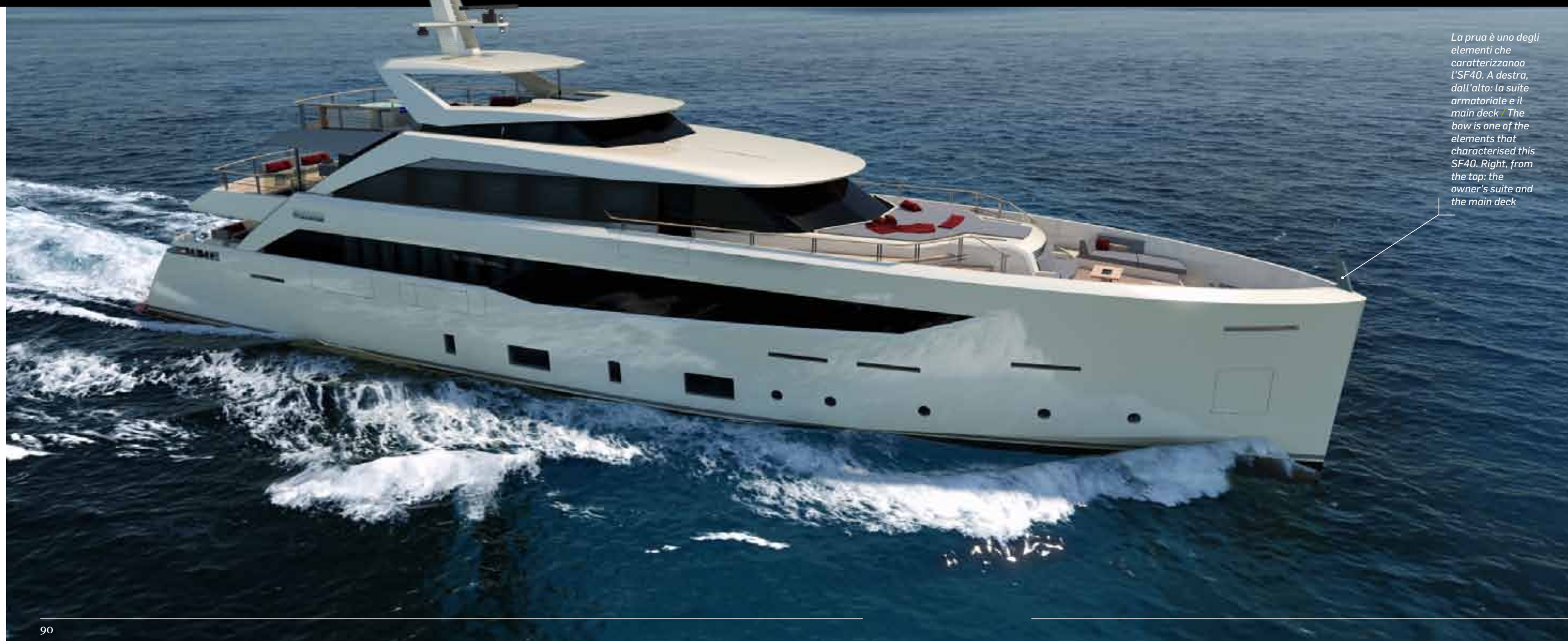
La prua è uno degli elementi che caratterizzano l'SF40. A destra, dall'alto: la suite armatoriale e il main deck. The bow is one of the elements that characterised this SF40. Right, from the top: the owner's suite and the main deck

a piacere, ogni tanto, poter andare controcorrente. E poter raccontare, in un momento in cui il mercato nautico italiano fa registrare una flessione del 70 per cento, di un cantiere che in meno di 10 mesi ha venduto due barche di 60 e 40 metri. E che barche! Dopo l'annuncio, lo scorso settembre, della vendita dell'M60 e la posa della sua chiglia nel maggio scorso, Mondo Marine ha infatti riferito di aver firmato il contratto per un 40 metri che sarà anche la prima unità di una nuova serie. Si tratta degli SF, barche progettate e vendute in collaborazione con SF Yachts che è il dealer esclusivo di Mondo Marine per il Medio Oriente e ha sede a Dubai. La numero uno è un 40 metri dislocante in alluminio con progetto navale di Mondo Marine Engineering e design di Luca Vallebona, un nome quasi del tutto nuovo nel panorama nautico mondiale. È la prima unità della linea SF Mondo Marine, un nuovo concetto di yacht che nasce dalla volontà di offrire un design pulito e una nuova concezione dei volumi sia interni sia esterni e un attento studio dei percorsi. «Già dal primo briefing l'armatore ha avanzato richieste impegnative», spiega Luca Vallebona, «voleva che gli spazi armatoriali e la sua cabina avessero una visione verso prua completamente sgombra e che gli venisse garantita la massima privacy rispetto ai percorsi dell'equipaggio.