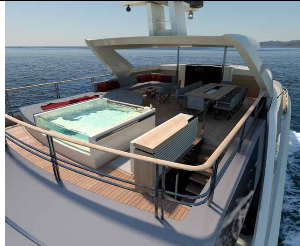
Sul sun deck è stata prevista anche una grande Jacuzzi con due dei lati realizzati in vetro trasparente / A large Jacuzzi is on the sun deck with two of the sides in transparent glass

process begun a year ago when Mondo Marine was sold and its production, communications, marketing and even its design and construction philosophy all changed. But what has remained the same is the Savona yard's wonderful craftsmanship and the technical skills used to built its yachts. ⚙️